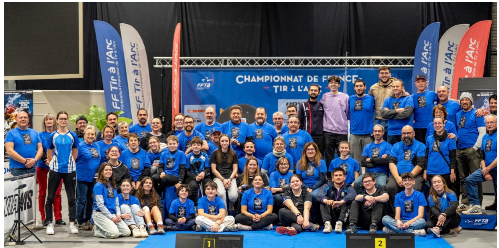
Photo d'une partie des bénévoles présents lors de l'organisation du Championnat de France de tir à 18m 2025. Près de 100 personnes, pour mener à bien cet évènement qui a rassemblé plus de 4000 personnes, archers, accompagnants, exposants et visiteurs. pendant 6 jours.

Nous proposons de nombreuses façons de mettre en avant nos partenaires : affichages